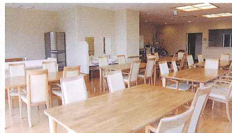
ご入浴後は、美味しい食事の後、居心地良いホールで趣味やレクリエーションなど自由な時間をお過ごし下さい。