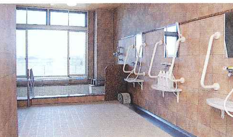
シャワーブースは利用者の方々に、安全・快適にご利用していただける様配慮し、安心の入浴介助を実施。