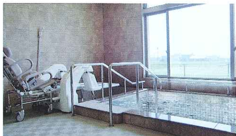
ゆったりと体を伸ばせる一般大浴槽他、座ったままでも入浴できるシャワーバスもご用意。